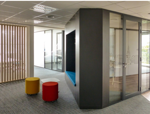
Aménagement de bureaux avec le panel de cloisons démontables Hoyerz H7