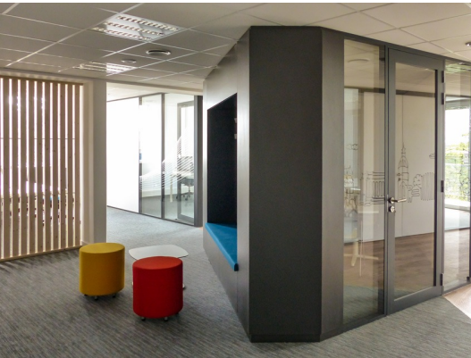
Aménagement de bureaux avec le panel de cloisons démontables Hoyez H7